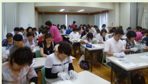
昨年もたくさんの方に参加して頂きました。